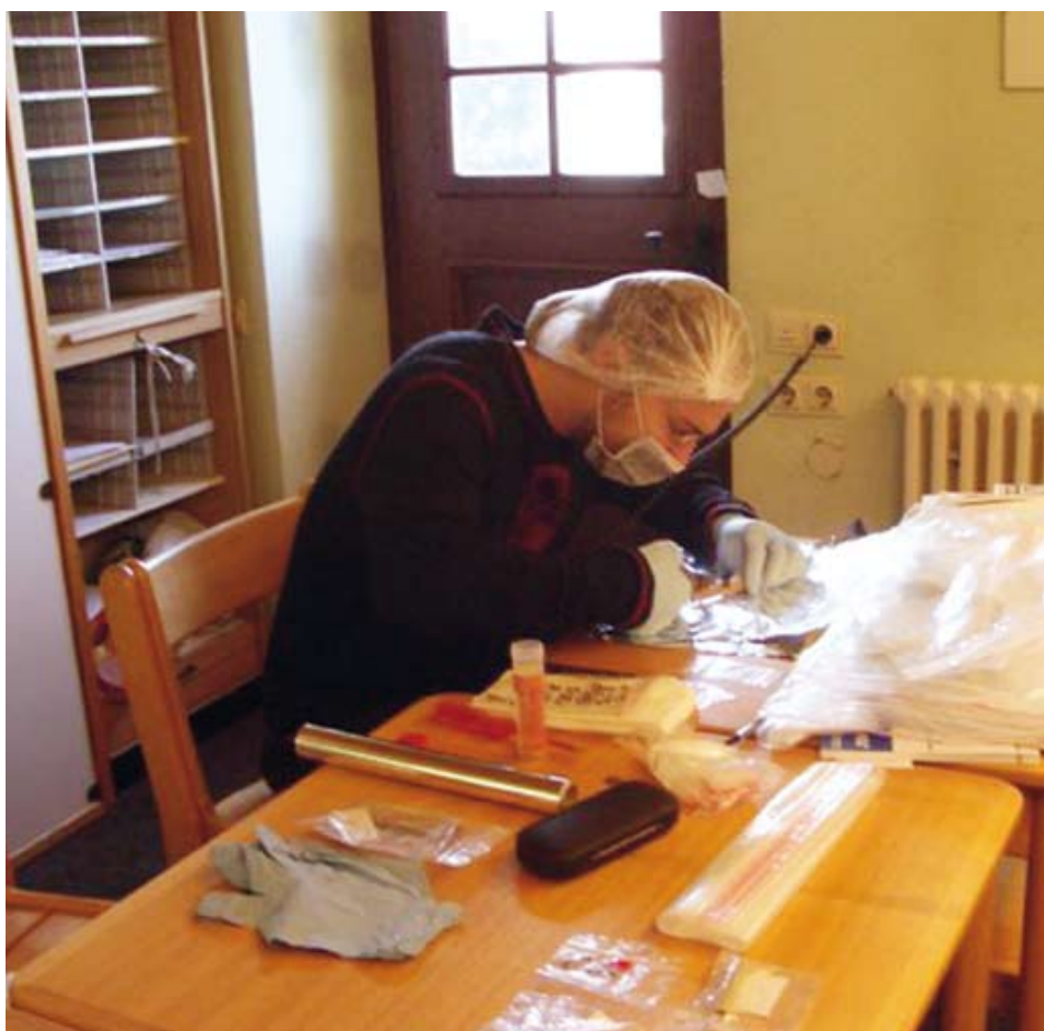
L'étude moderne des origines de notre espèce s'effectue surtout en laboratoire. Les chercheurs s'habillent comme des chirurgiens, masques et filets à cheveux compris.