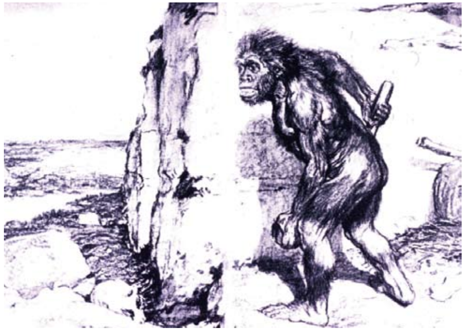
Lors de la découverte du Néandertalien dans la Néandertal (vallée Neander) allemande, notre proche cousin était encore considéré comme un véritable monstre. Plus de cinquante ans après, nous le voyons sous un jour beaucoup plus distingué.

Le moment important sera celui où tous les gènes d'un Néandertalien, son génome, auront été cartographiés. L'équipe de recherche de Svante Pääbo a récemment présenté une première version grossière. Malheureusement, elle n'a pu découvrir que soixante pour cent de tous les gènes. Ils ne contenaient en effet aucune preuve de croisement mais, ont avoué les chercheurs, de nombreuses données d'étude demandent encore une interprétation. S. Pääbo espère d'ailleurs pouvoir disposer du génome complet d'ici deux à trois ans. Chacun est bien entendu curieux de savoir ce que cachent les quarante pour cent résiduels du génome néandertalien. Si l'on devait vraiment y trouver la preuve d'un mélange, cela ne pourrait venir que d'un côté surprenant. De nombreux scientifiques spéculent en effet sur le fait que ce sont les "beaux mâles" d'Homo sapiens sapiens qui ont disséminé leurs gènes parmi les femmes néandertaliennes. Les chromosomes des Néandertaliens vont largement en ce sens. L'ADN masculin des Néandertaliens n'a précisément guère été étudié jusqu'ici. L'ADN mitochondrial, qui est toujours celui qui est analysé, se transmet en effet de mère en fille. On n'y retrouve donc pas