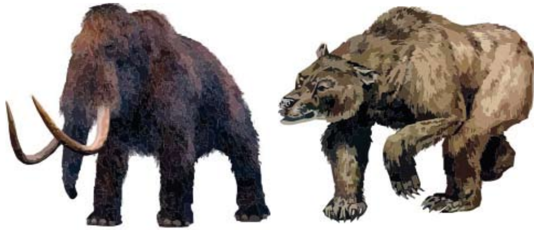
Le Néandertalien n'était probablement pas le seul être porteur d'une chevelure rousse. Il est possible que le mammoth et l'ours des cavernes aient aussi porté le poil roux.

jeune surfeur qui parlait avec enthousiasme de sa "Néandertalienne de feu". "La variante du gène que nous avons trouvé chez les Néandertaliens n'existe pas chez l'homme. Les cheveux roux se sont donc développés indépendamment dans les deux espèces." Ceci signifie que les ancêtres communs de l'homme moderne et du Néandertalien n'avaient pas de cheveux roux et que ce caractère ne s'est développé chez les deux espèces qu'après leur