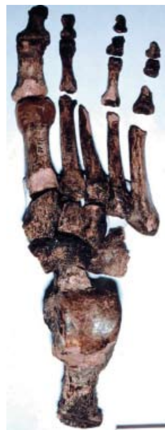
Une petite modification au petit orteil peut indiquer une grande invention datant d'il y a trente mille ans: la chaussure.