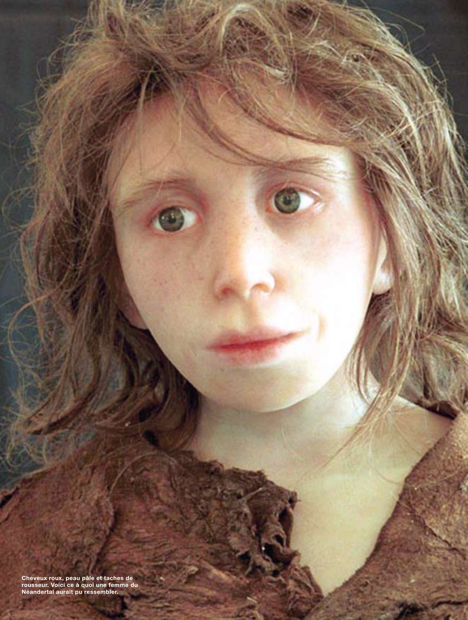
Cheveux roux, peau pâle et taches de rousseur. Voici ce à quoi une femme du Néandertal aurait pu ressembler.