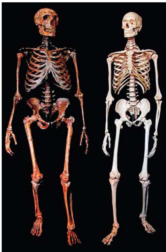
Squelettes d'un Néandertalien et d'un homme moderne fraternellement réunis.